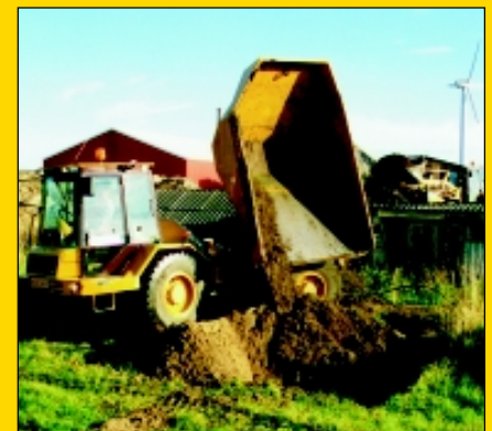
90° Multikipp an beide Seiten.