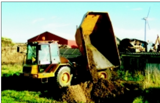
Abladung ist ganz einfach durchgeführt.