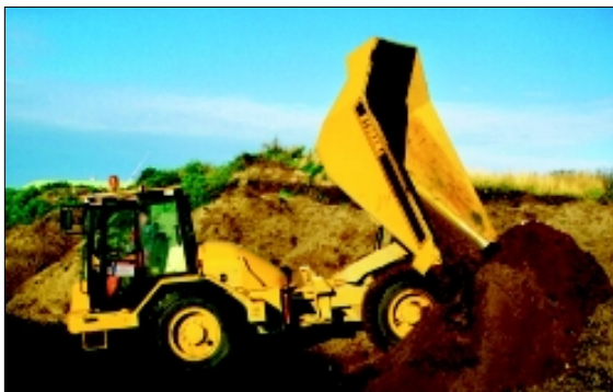
Abladung in 45° Winkel