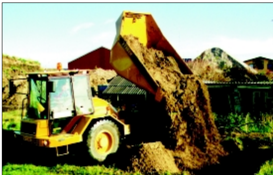
Die Mulde wird gedreht und gekippt in einer Arbeitsgang.