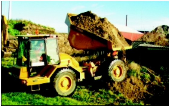
Anfang des Abladen.