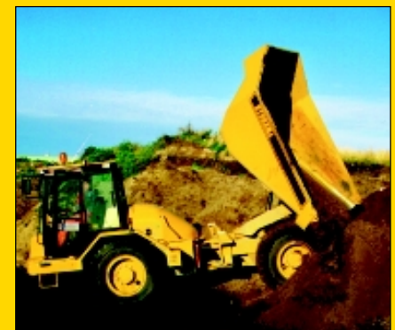
45° Multikipp an beide Seiten.