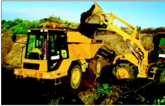
Beladung der 912